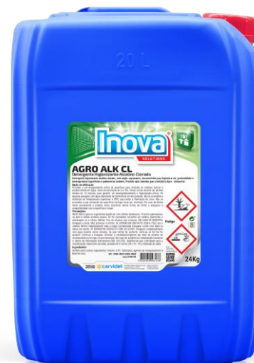
IMAGEM DE PRODUTO

Detergente Higienizante Alcalino Clorado