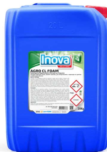
IMAGEM DE PRODUTO

Detergente Higienizante Clorado em Espuma