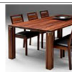
Superfícies de madeira