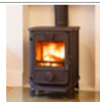
Salamandras e lareiras